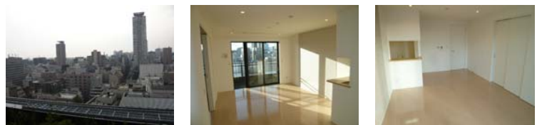
西向きでベイエリア一望 日当良好のリビング ダイニングでゆとりの食事を