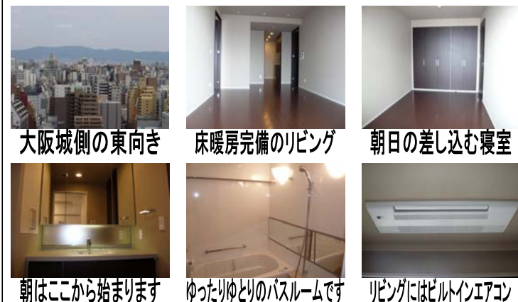
大阪城側の東向き 床暖房完備のリビング 朝日の差し込む寝室 朝はここから始まります ゆったりゆとりのバスルームです リビングにはビルトインエアコン