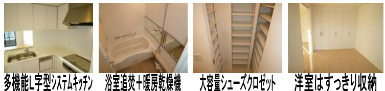
多機能L字型システムキッチン 浴室追焚き+暖房乾燥機 大容量シューズクローゼット 洋室はすっきり収納

◆15階部分◆専有面積/55.26㎡◆共益費/賃料に込み◆敷金:210,000円礼金:420,000円