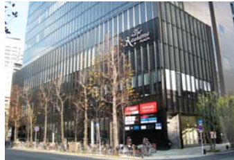
商業施設THE Kitahama PLAZA