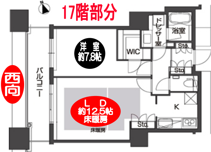
◆17階部分●専有面積/56.16㎡●共益費/賃料に込み●敷金:220,000円礼金:440,000円

充実の共用施設が魅力 (ビューラウンジ・ガーデンカフェ ・スカイブルー・AVルームなど)